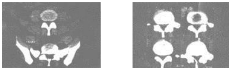
娜塔莉亚·聂哥尼克的椎间盘突出 X 光片

于 2003 年 6 月，我被带入柯维教会的一名会友的房子，当时他们正在进行礼拜。牧师说要为有病痛的人祷告。强忍着痛楚，我勉强地跪了下来寻求医治的祷告。在祷告时，上帝强大的力量降临。牧师奉主耶稣基督之名，把右手按在我的头上祷告。那时，我感到上帝的力量在我发痛的背部运行。我感到有一波波的电流通过我的身体，就如人在接受间动电疗法一样。我不再感到疼痛，上帝竟在瞬间医治了我！我当时的喜乐是笔墨难以形容的。当祷告结束后，我快速地直立身体站起来，这之前，我根本无法做到。我开始行走、作弯腰动作，我不再感到疼痛。如今，我仍收藏着那再也用不着的沉重的特殊腰带，以及那张显示两个椎间盘突出的 X 光片作为我曾患病的物证。非常感激上帝的恩典！